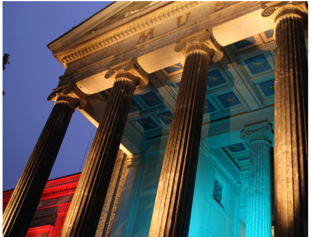
Kulturnacht am 29. Oktober: Unter der Devise „Einmal zahlen – Alles erleben“ können Kulturbegeisterte in der längsten Nacht des Jahres ein Programm voller Musik, Theater, Ausstellungen, Puppenspiel und Literatur erleben.

Im Kunst-Wasser-Werk in Neumühle besteht zum letzten Mal die Gelegenheit, die Ausstellung „Körperstationen“ des Berliner Künstlers Rolf Biebl zu sehen, während Stimmgewaltiges vom „Duo Ferine“ zu hören ist. Ausstellungseröffnung wird in der Galerie Berger gefeiert und „Susan feel good“ aus Kiel betört derweil das Publikum mit