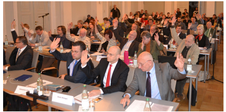
Abstimmung in der Stadtvertretung.