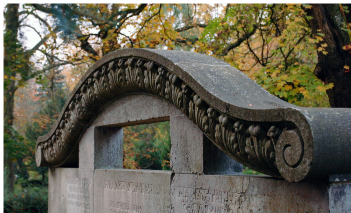
Grabstein auf dem Alten Friedhof

Die Nutzungsberechtigten werden aufgefordert, die Grabmale unverzüglich durch einen Steinmetz wieder ordnungsgemäß befestigen zu lassen. Die mit einem Aufkleber gekennzeichneten Grabmale, die nicht bis zum 31.08.2017 befestigt wurden, können auf Kosten des Nutzungsberechtigten von der Friedhofsverwaltung gesichert werden. Grabmale, von denen unmittelbar Gefahr ausgeht, werden sofort auf die Grabstätte