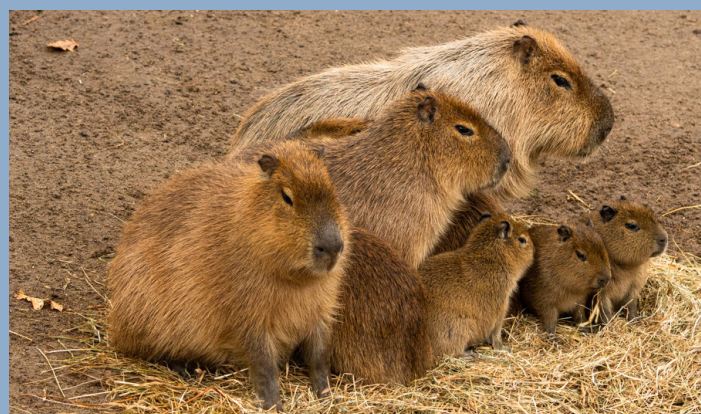
Familie Wasserschwein beim Frühstück.

Die Südamerika-WG erlebt derzeit viel Zuwachs. Nachdem vor kurzem 3 Vikunjas bei den Wasserschweinen, Großen Maras und Tapiren eingezo-gen sind, haben nun unsere Wasserschweine für Nachwuchs gesorgt. Insgesamt 4 Jungtiere, ein männliches und 3 weibliche bereichern derzeit das Familienleben. Wasserschweine werden auch Capybaras genannt, was „Herr des Grases“ bedeutet. Diesen Namen verdanken sie ihrem Hauptnahrungsmittel - sie ernähren sich hauptsächlich von Gräsern und Wasserpflanzen. Sie kommen daher in sehr großer Anzahl in grasdominierten Feuchtgebieten Südamerikas vor.