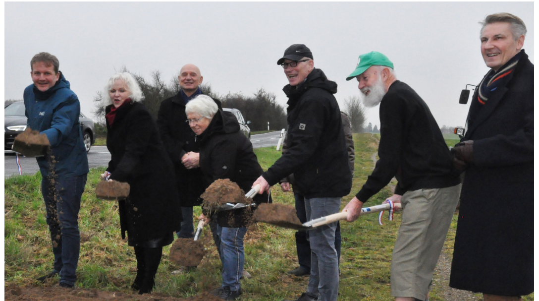
Spatenstich für den 1,3 Km langen ersten Bauabschnitt des neuen Radweges von Lankow nach Groß Medewege.

Innerhalb dieses Abschnittes wird der Radverkehr linksseitig in einem Schutzstreifen auf der Fahrbahn geführt. Ab der Querung am Ziegelhof in Richtung Klein Medewege führt der Radweg dann rechtsseitig neben der Fahrbahn als Zweirich-