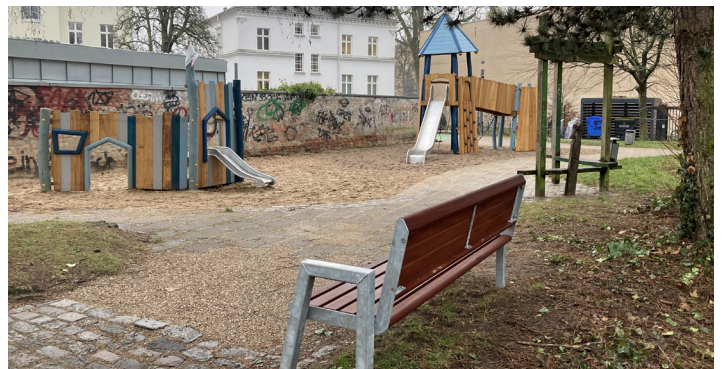
Die Spielgeräte im Aussehen einer Ritterburg mit Wallanlage und die neue Bank laden zum Spielen und Verweilen ein.

der aktuellen Spielplatzkonzeption der Landeshauptstadt Schwerin erfolgreich umgesetzt werden.